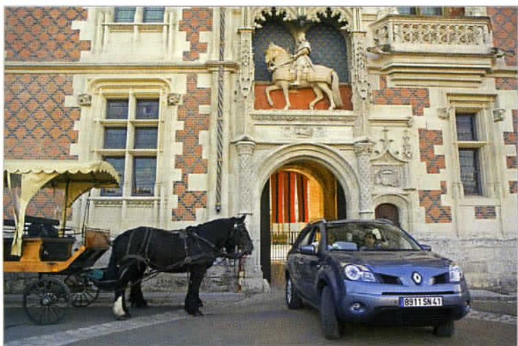
Il est possible de visiter Blois et ses bords de Loire à l'allure placide des percherons, dans un attelage aménagé à cet effet.